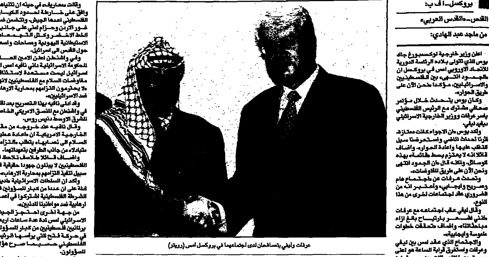
مرات وايبي يتفانسا لدى اجتماعهما في بروكسل

القدس - القدس العربي: أعلنت إسرائيل أنها تحتجز أربعة مسؤولين من حركة فتح في الضفة الغربية، في خطوة قالت إنها تهدف إلى تعزيز عملية السلام. وفي وقت لاحق، أعلنت إسرائيل أنها ستستأنف عملية السلام بالشرق الأوسط، في خطوة قالت إنها تهدف إلى تعزيز عملية السلام. وفي وقت لاحق، أعلنت إسرائيل أنها ستستأنف عملية السلام بالشرق الأوسط، في خطوة قالت إنها تهدف إلى تعزيز عملية السلام.